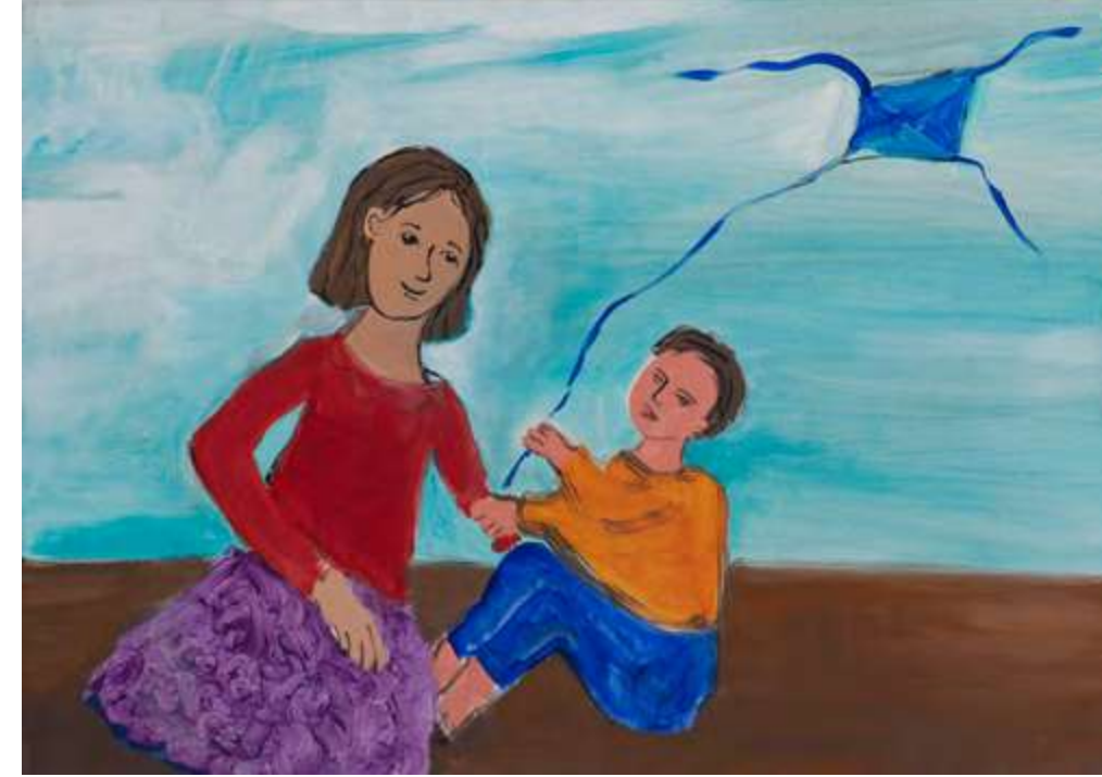
En vuelo Irina Messianu Acrílico sobre lienzo 70 x 55 cm

Entrevista realizada por: Fredel Saed Raffoul